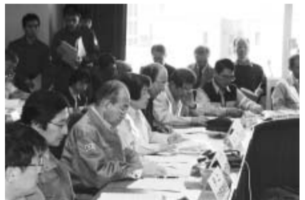
千葉県庁での県市合同対策協議会運営訓練