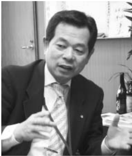
プロフィール 1950年長生郡長生村生まれ 元NTT社員 2002年5月より長生村議会議員 2004年7月より長生村長、現在1期目

財政のこともありますが、自治はあまり大きくないほうがいいというのが私の持論です。合併すると広域行政になり身近に議員がいなくな