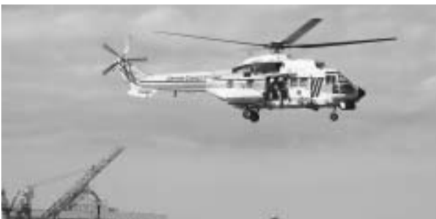
千葉港千葉中央埠頭での化学テロに伴う検知・救助・除染・武装グループ鎮圧、および人質救出訓練の一部