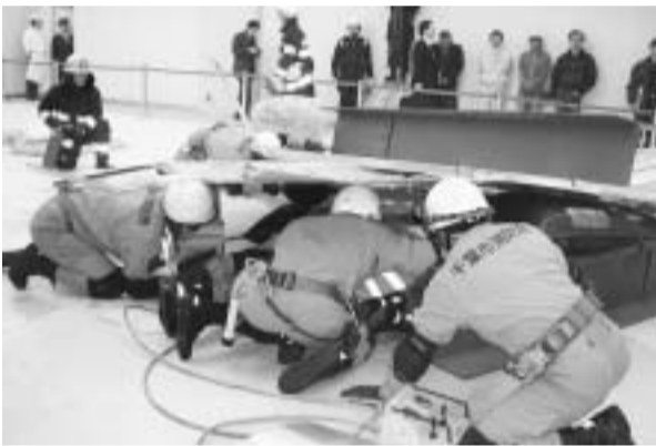
海浜幕張駅構内爆破テロ想定現場での救助訓練