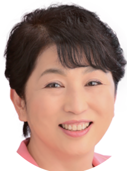
福島みずほ 参議院議員